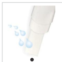
Chorro de orina